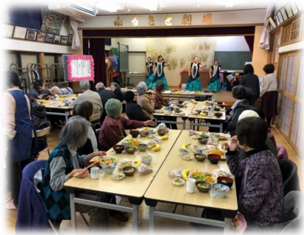
★第二団地ふれあい・いきいきサロン お食事会の様子です★

ふれあい・いきいきサロンとは、各行政区で住民交流や世代間交流を目的に実施しているサロンです。地区の実情に応じてさまざまな活動を行っています。