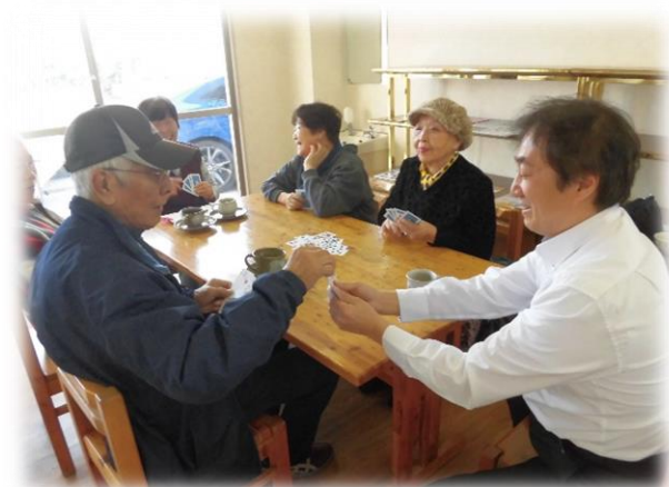
ななふくオレンジカフェ