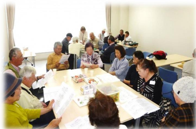
☆くらしワンストップ MOROHAPPINESS 館 4階第2会議室にて開催しています☆