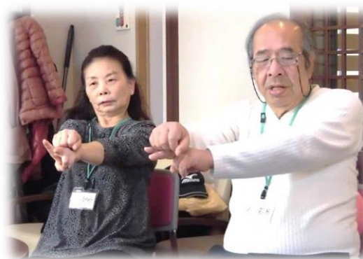
あったかオレンジカフェ

オレンジカフェとは、認知症のひと・その家族・認知症が心配なひと・認知症に関心があるひとが参加できるカフェです。楽しくおしゃべりをしたり、体を動かしたりしながら、元気に歳を重ねましょう。