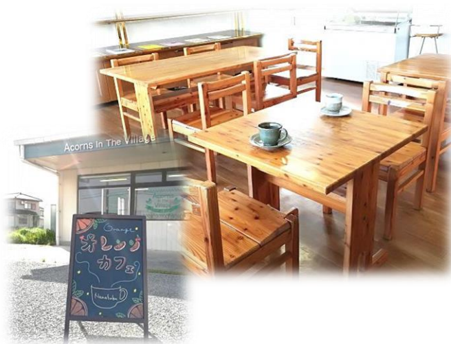
ななふくオレンジカフェ