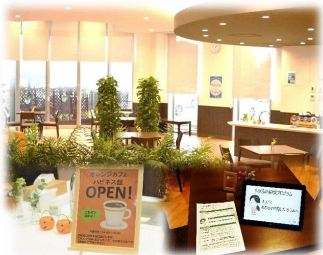
オレンジカフェ ハピネス館