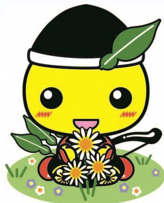
毛呂山町マスコットキャラクター もろ丸くん

住み慣れた地域で、 いつまでも安心に・自分らしく・ いきいき暮らすまち・もろやま ～もろやまふれあいマップ～