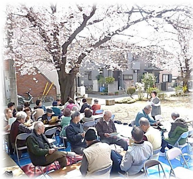
第3団地ふれあい・いきいきサロン (交友会) お花見会

ふれあい・いきいきサロンとは、各行政区で住民交流や世代間交流を目的に実施しているサロンです。地区の実情に応じてさまざまな活動を行っています。