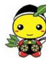
もろ丸くん (毛呂山町)