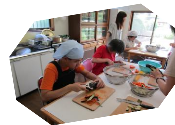
◎お楽しみ昼食会「カレー作り」