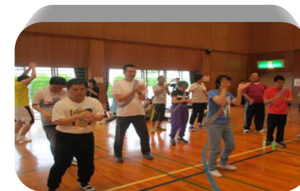
◎近隣施設交流会 「ミニ運動会」

歯みがきセット（ブラシ・コップ）、お茶用コップ、連絡帳（ノート）、上履き、着替え（寒暖期・運動時等）