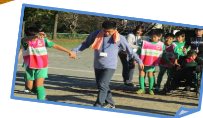
◎少年サッカークラブとの交流活動

作業所では日中活動などをお手伝いいただけるボランティアさんも随時募集しています。短時間でも大丈夫ですのでまずはお気軽にお問い合わせください