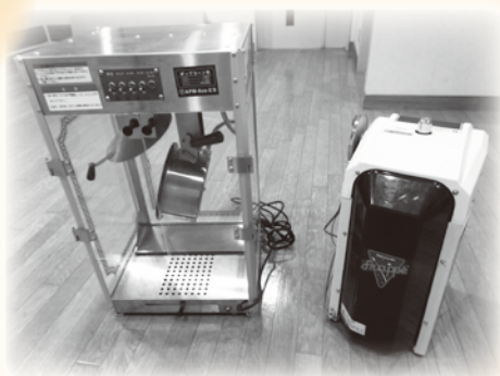
・ポップコーン機 ・かき氷機

※会員会費につきましては、福祉車両や車いすの貸出、ふれあい・いきいきサロンの助成金、困りごと援助サービス、福祉教育など多くの事業に活用させていただきます。