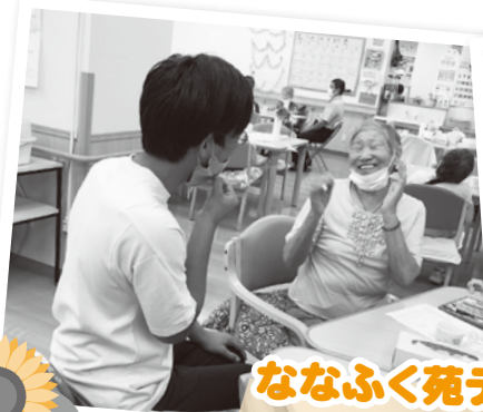
ななふく苑デイサービス体験