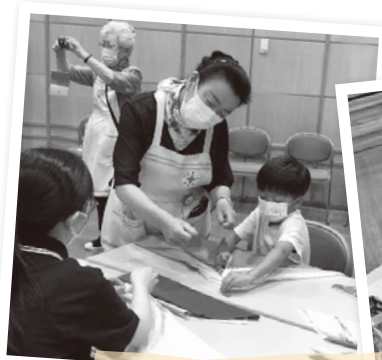
災害時に役立つ豆知識と体験