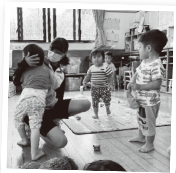
旭台保育園 保育体験