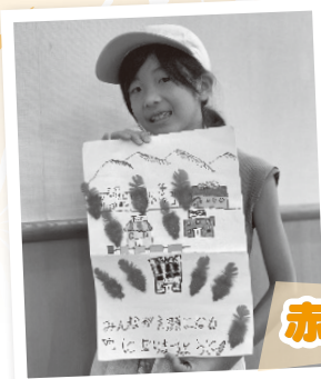
赤い羽根共同募金ポスターづくり