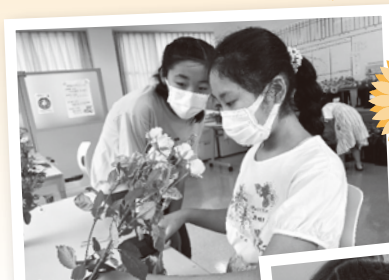
光の家 ワンダーハウス フラワー アレンジメント