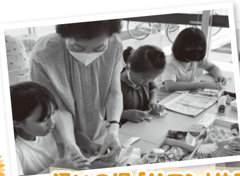
通いの場「サロン」体験 あすなろサロン