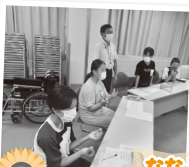
ななふく苑手話体験