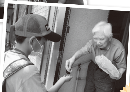
お弁当配達ボランティア