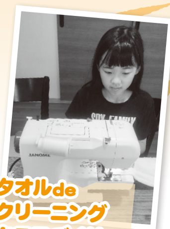
タオルde クリーニング クロスづくり