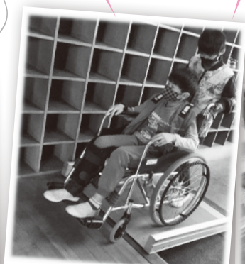
車いす体験+高齢者疑似体験