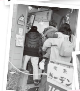
17 時になると受け取りに