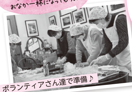
ボランティアさん達で準備♪