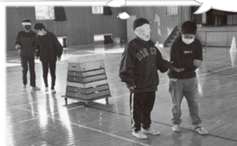
視覚障害体験(ガイドヘルプ体験)