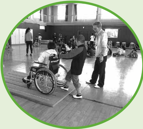
◀ 福祉教育支援事業