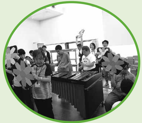
▶ 障害福祉サービス事業所 運営（あいあい作業所・ あいあい滝ノ入作業所）