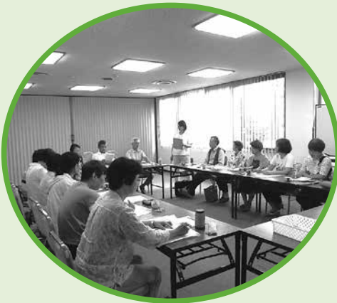
◀ 各種ボランティア講座

事業を進めるにあたっては皆さまからの会員会費を有効に活用させていただき、「地域」で「人（住民）」による大きな「ふくし」の「輪」が広がるようこれからも活動していきます。