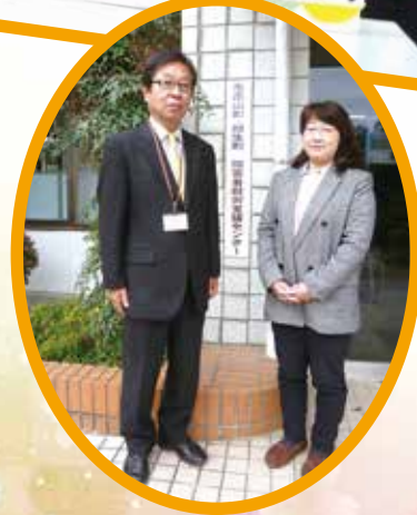
▲障害者就労支援センター