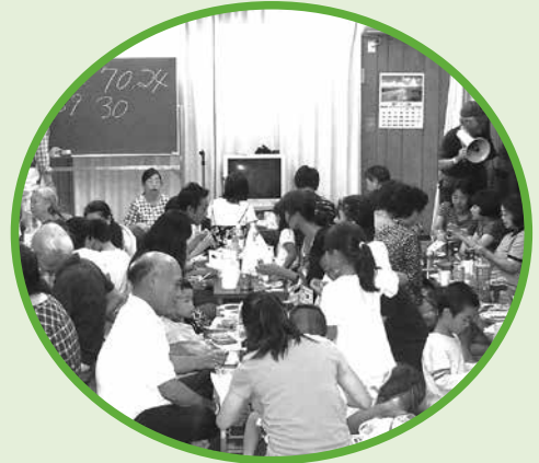
▶ ふれあい・いきいき サロン事業