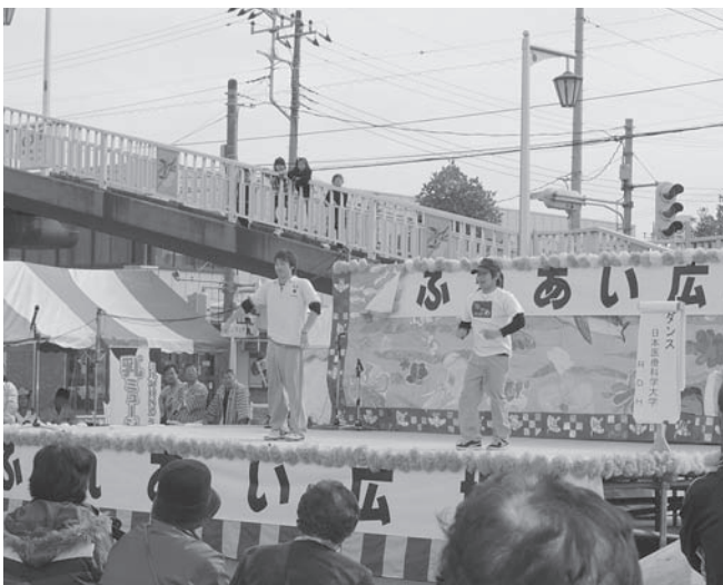
④ 日本医療科学大学「R・D・H」ダンス