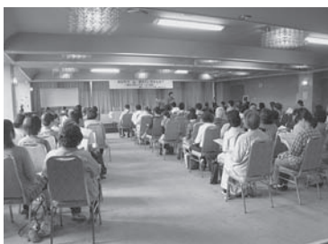
第 4 回メンタルヘルス講座

心に病気がある方も安心して生活できる地域作りを目指し、ボランティアの育成と、地域の方々の理解を深める為に精神保健福祉ボランティア講座を全 4 回の日程で開催しました。地域のネットワークを広げるために鳩山町と共催で行った今回の講座でしたが、鳩山町から 8 名、毛呂山町からは 5 名の方々に参加していただきました。