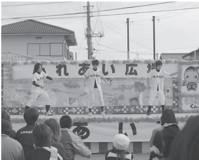
⑧坂戸高校「高校舞児」ダンス