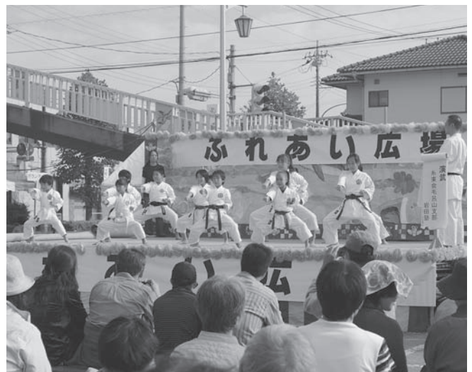
⑦糸東会毛呂山支部岩田塾による「空手演武」