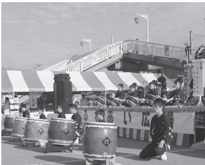
⑩武蔵越生高校「和太鼓部青龍」