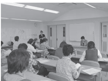
第 3 回目 臨床心理士の講義

心に病気がある方も安心して生活できる地域作りを目指し、ボランティアの育成と、地域の方々の理解を深める為に精神保健福祉ボランティア講座を全 4 回の日程で開催しました。地域のネットワークを広げるために鳩山町と共催で行った今回の講座でしたが、鳩山町から 8 名、毛呂山町からは 5 名の方々に参加していただきました。