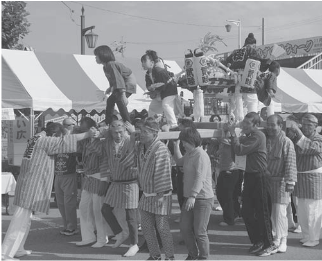
② 第 2 団地神輿保存会