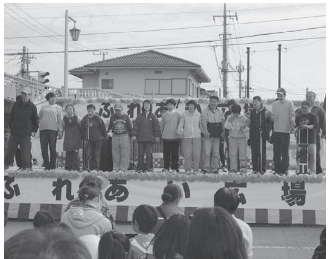
⑥あいあい園のマリンバ演奏