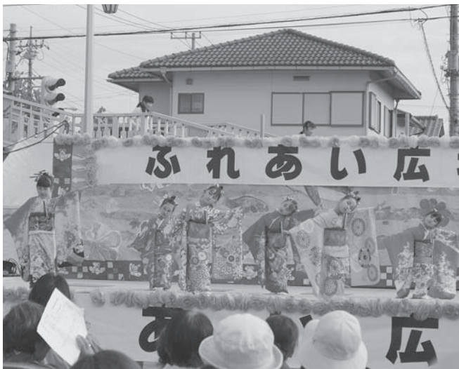
⑨あけぼの幼稚園「民踊」