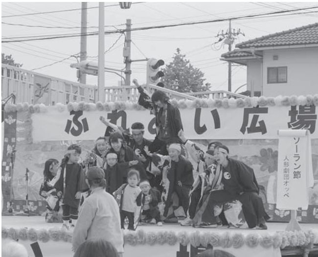
③ 人形劇団オッペ「ソーラン節」