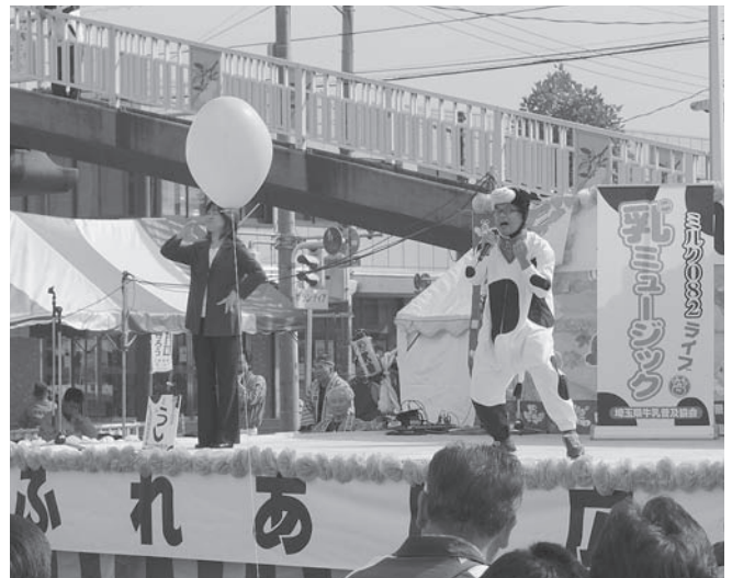
⑤埼玉県牛乳普及協会「ミルク082」