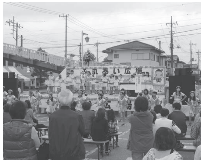
① 川角小学校音楽クラブ・バトンクラブ

「ふれあい広場」は、福祉へのふれあいと交流の輪を広めていただくこと、社会福祉協議会が 町内の福祉施設や団体、ボランティア等の協力を得て毎年実施しているものです。 曇り空で始まりましたが、やがて穏やかな日差しが差し込み、良い一日となりました。 会場内では、ステージ発表のほか、施設・団体の紹介展示や手話や車イスを体験するコーナー等、 多くの方が楽しんで参加されていました。