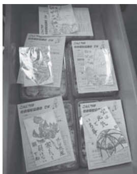
※絵手紙サークルさんの作った絵手紙を添えて

1回目の講座では、事業概要の説明や民生委員さんの配達体験談、ボランティアとしての心得などの説明を行いました。また、各配達グループに分かれての話し合いも行われ、積極的な意見交換がされていました。