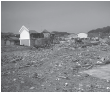
※福島県いわき市久之浜

当日は、福島県いわき市で、被災したお宅の片付け作業を行いました。現場に到着し、初めに目にしたのは、津波と火事によって倒壊した集落でした。