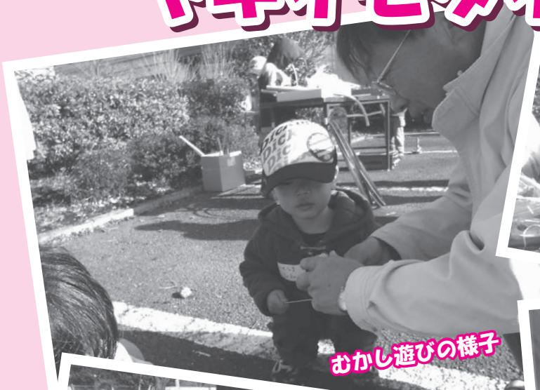
おかし遊びの様子