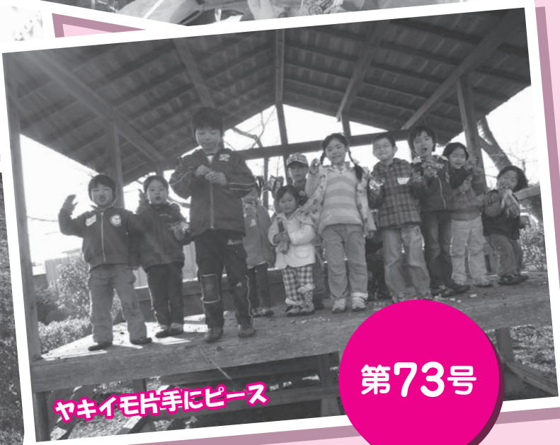
ヤキイモ片手にピース