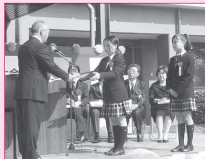
▲賞状授与式の様子