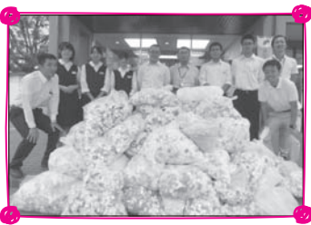
◎川角中学校のみなさんよりペットボトルキャップをお寄せいただきました。