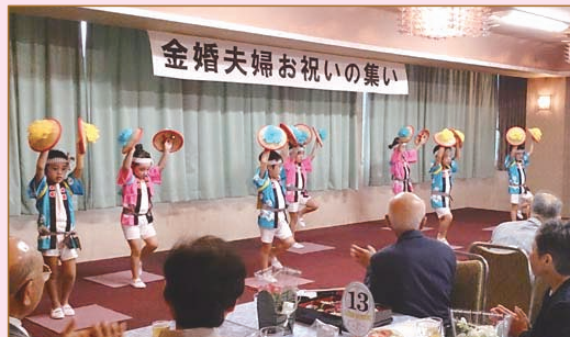
▲あけぼの幼稚園のみなさんによる演技