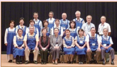
▲お手伝いしていただきました 民生委員・児童委員高齢者福祉部会の皆様