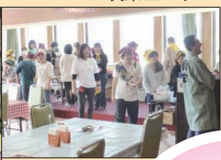
▲販売 (手作り品 飲食 等)