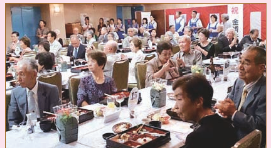
▲お食事とご歓談されている皆様の様子