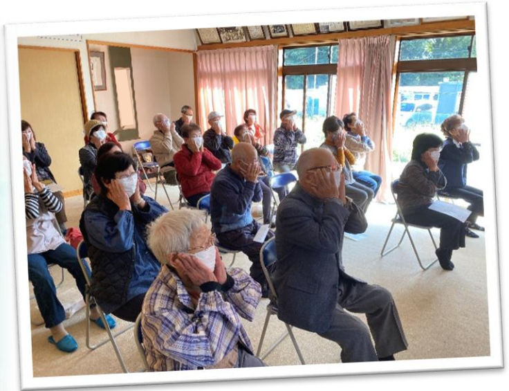
～苦林地区 いきいきサロンの様子です～

ふれあい・いきいきサロンとは、 各行政区で住民交流や世代間交流を 目的に実施しているサロンです。 地区の実情に応じてさまざまな活 動を行っています。