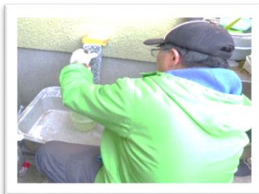
(水道パッキンの交換)