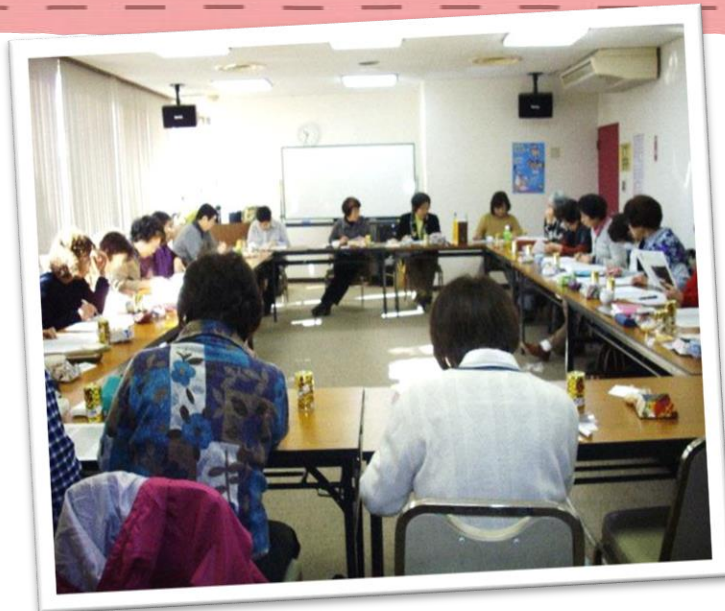
☆毎月スタッフが集まり、利用者様の対応や活動について話し合いをしています☆

友愛毛呂山は、ボランティアスタッフによる有償の家事援助サービスグループです。生活支援や外出支援など利用者様の希望に合わせた活動を行っています。