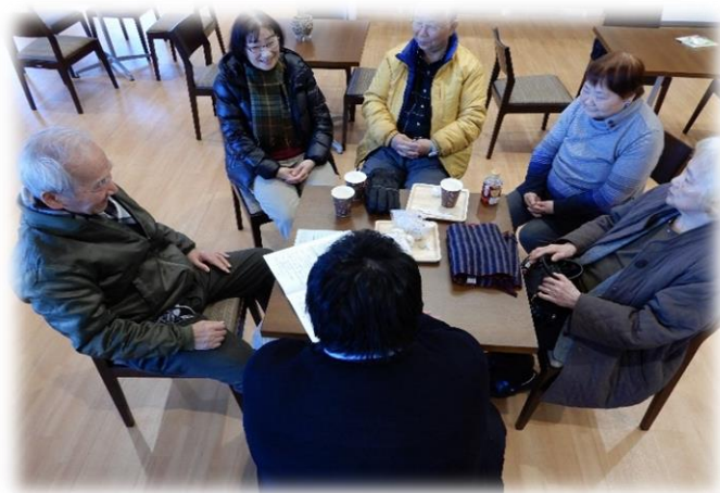
オレンジカフェ ハピネス館