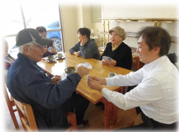
ななふくオレンジカフェ