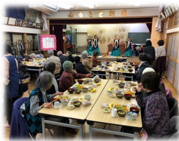
★第二団地ふれあい・いきいきサロン お食事会の様子です★

ふれあい・いきいきサロンとは、各行政区で住民交流や世代間交流を目的に実施しているサロンです。地区の実情に応じてさまざまな活動を行っています。