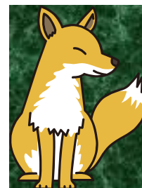
マスコットキャラクター 毛呂っ狐(Morocco)