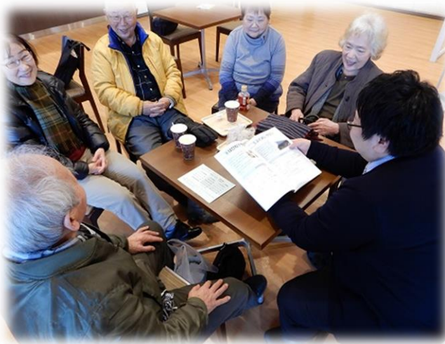
オレンジカフェ ハピネス館