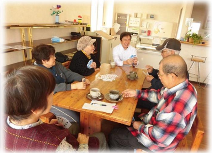
ななふくオレンジカフェ