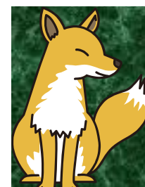
マスコットキャラクター 「毛呂っ孤」ちゃん。