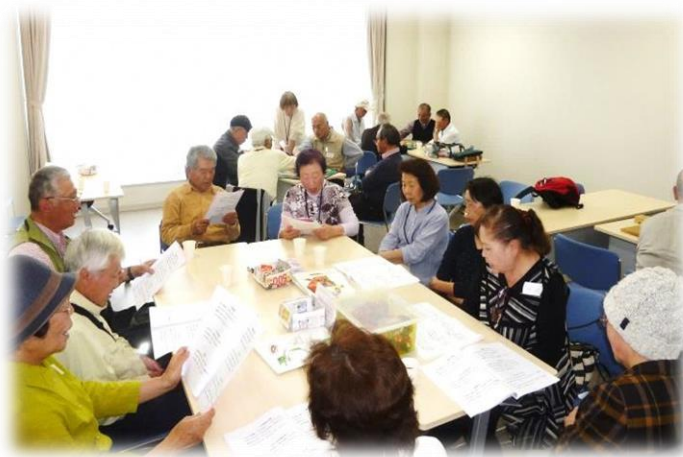
☆くらしワンストップ MOROHAPPINESS 館 4階第2会議室にて開催しています☆