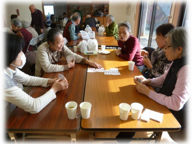
第三団地ふれあい・いきいきサロン

ふれあい・いきいきサロンとは、各行政区で住民交流や世代間交流を目的に実施しているサロンです。地区の実情に応じてさまざまな活動を行っています。