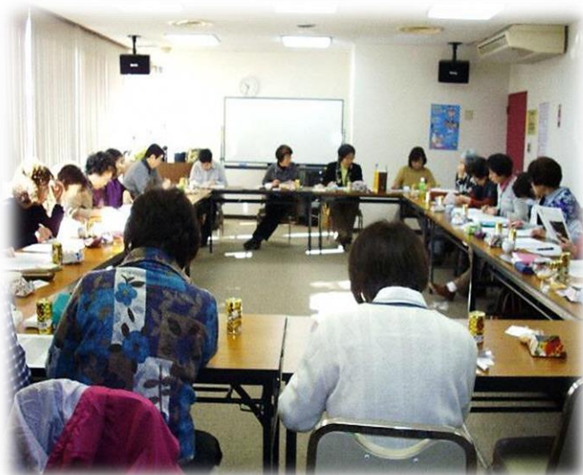
☆毎月スタッフが集まり、利用者様の対応や活動について話し合いをしています☆

友愛毛呂山は、ボランティアスタッフによる有償の家事援助サービスグループです。生活支援や外出支援など利用者様の希望に合わせた活動を行っています。