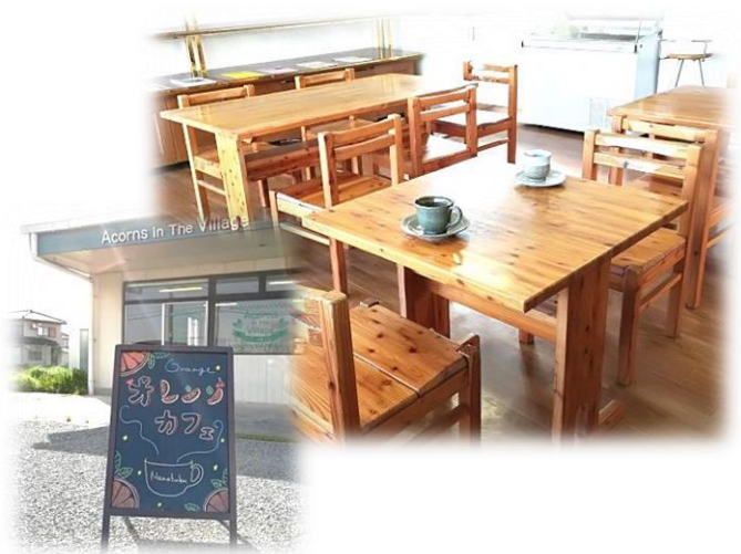
ななふくオレンジカフェ