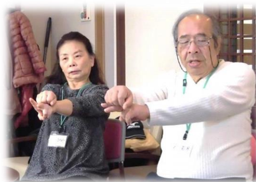
あったかオレンジカフェ

オレンジカフェとは、認知症のひと・その家族・認知症が心配なひと・認知症に関心があるひとが参加できるカフェです。楽しくおしゃべりをしたり、体を動かしたりしながら、元気に歳を重ねましょう。