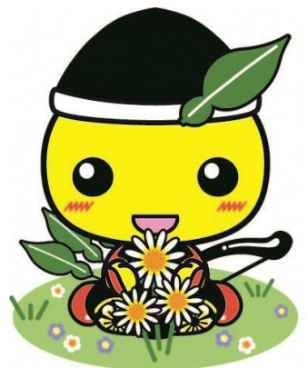
毛呂山町マスコットキャラクター もろ丸くん

住み慣れた地域で、 いつまでも安心に・自分らしく・ いきいき暮らすまち・もろやま ～もろやまふれあいマップ～