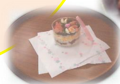
七夕まつりカップ寿司