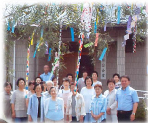
苦林地区ふれあい・いきいきサロン 七夕まつり

ふれあい・いきいきサロンとは、各行政区で住民交流や世代間交流を目的に実施しているサロンです。地区の実情に応じてさまざまな活動を行っています。