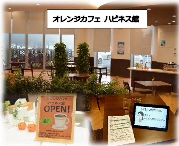
オレンジカフェ ハピネス館