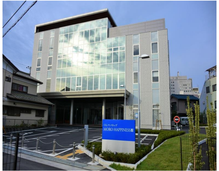
くらしワンストップ MOROHAPPINESS 館 4階第2会議室で実施します☆