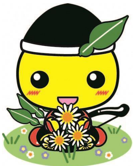
毛呂山町マスコットキャラクター もろ丸くん

住み慣れた地域で、 いつまでも安心に・自分らしく・ いきいき暮らすまち・もろやま ~ もろやまふれあいマップ ~