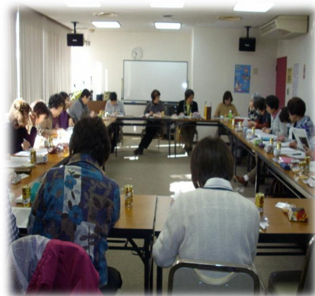
毎月スタッフが集まり、利用者様の対応や活動について話し合いをしています。

友愛毛呂山はボランティアスタッフによる有償の家事援助サービスです。生活支援や外出支援など利用者様の希望に合わせた活動を行っています。