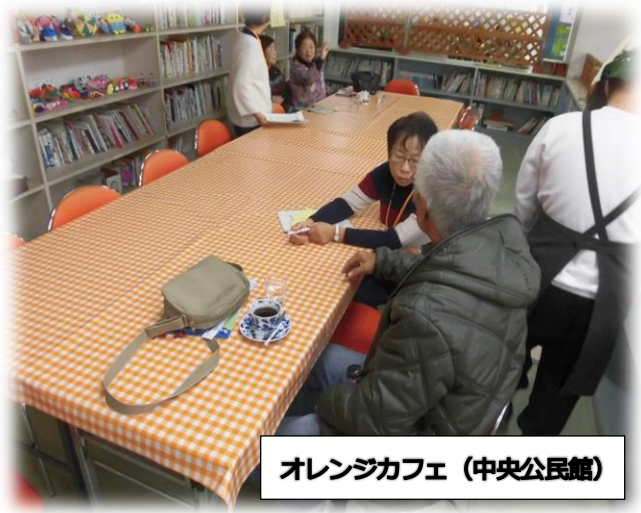
オレンジカフェ (中央公民館)