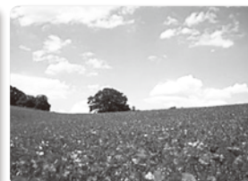
秩父高原牧場「天空のポピー」