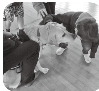
← 昨年度の様子(盲導犬体験)