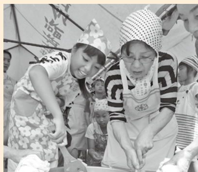
炊出し体験の様子