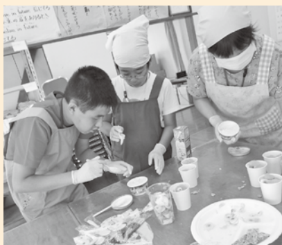
あいあい滝ノ入作業所 クッキング体験の様子