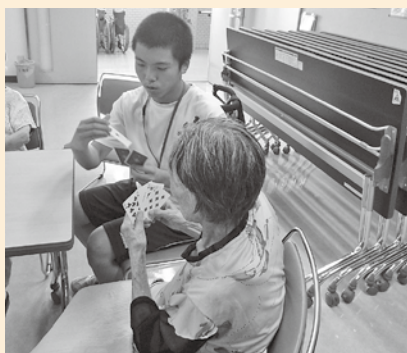
悠久園デイサービス体験の様子