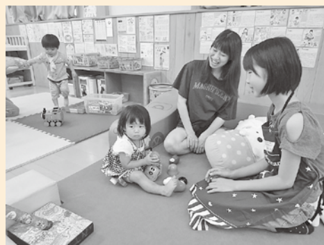
子育て支援センター体験の様子