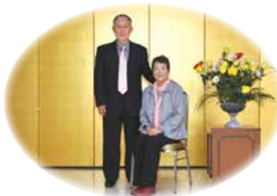
ご夫婦の記念撮影