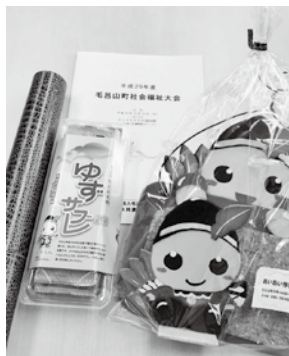
▲受賞者におくられた記念品