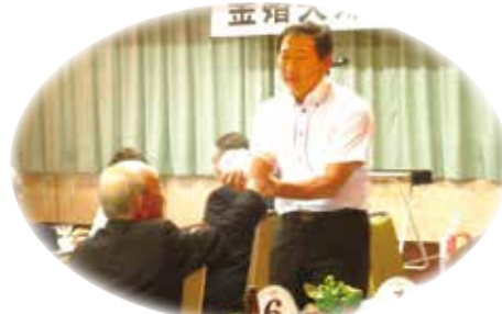
町長によるトランプマジック