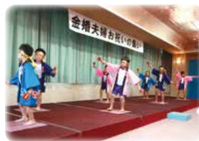
あけぼの幼稚園の皆様による演技