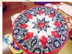
▲長瀬三区いきいきサロンの様子 茶話会にてタペストリー(右下)を制作