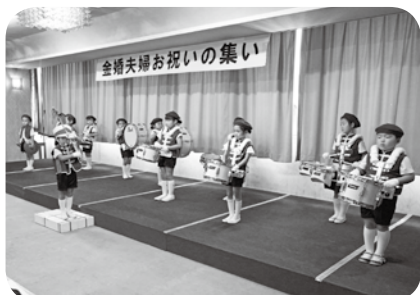
▲あけぼの幼稚園の皆様による演技