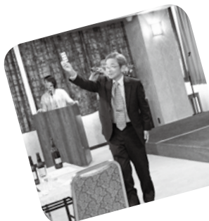
▲トランプマジック的一幕