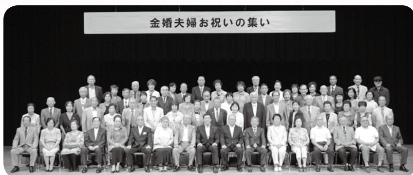
▲お祝いの集いにご出席頂いた32組の皆様