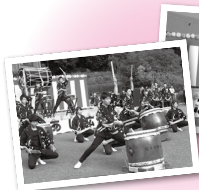
▲武蔵越生高校による和太鼓演武