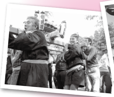
▲第二団地神輿保存会 によるおみこし