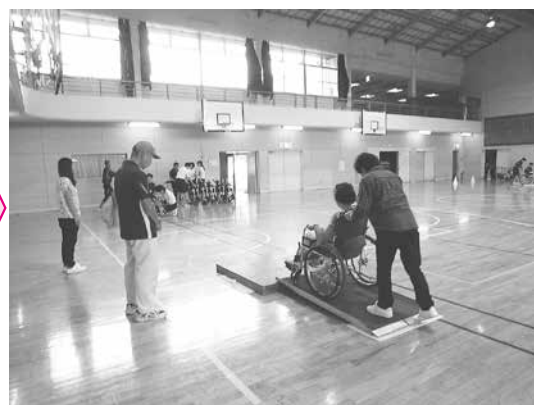
ボランティア体験の様子

座学では、ボランティアの基礎知識や基本的な傾聴の他に、認知症に関する講義も行いました。