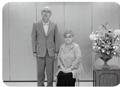
▲ご夫婦の記念写真

来年度対象のご夫婦は《昭和41年9月16日～昭和42年9月15日》に婚姻届を提出された方です