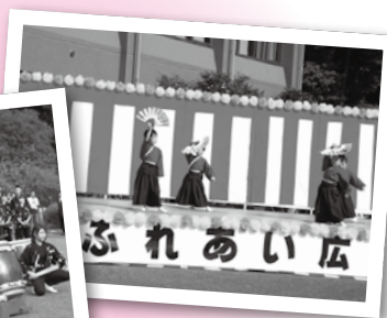
▲あけぼの幼稚園 による踊り