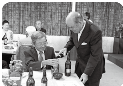
▲ご友人との語らい