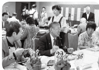
▲お食事とご歓談されている皆様の様子