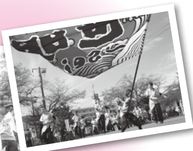
▲世明による よさこい