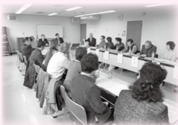
昨年度行われた実施地区による情報交換会の様子

また、制度の詳しい説明等をご希望される地区にはお伺いしますのでお気軽にお申し付けください。