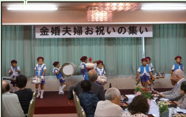
※あけぼの幼稚園の園児による鼓笛演奏